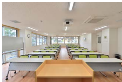
集会室兼地域交流室